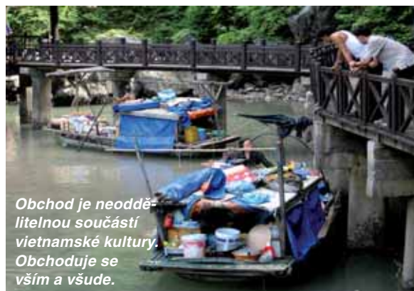
Obchod je neoddělitelnou součástí vietnamské kultury. Obchoduje se vším a všude.

To vše však s sebou přináší také některé negativní jevy. Jedním z nich je odsunutí problematiky péče o životní prostředí až na jednu z posledních příček priorit. Termín trvale udržitelné využívání přírodních zdrojů je chápán jako něco, co ekonomický rozvoj brzdí a omezuje právo Vietnamců na život v luxusu. Vzhledem k historii Vietnamu je tento přístup zcela pochopitelný. Ostatně i my Češi stále procházíme podobnou transformací v žebříčku hodnot. O to více jsou projekty zahraniční rozvojové spolupráce v oboru životního prostředí nebo zemědělství ve Vietnamu potřebné. A o to více dává smysl, že je Vietnam reali-