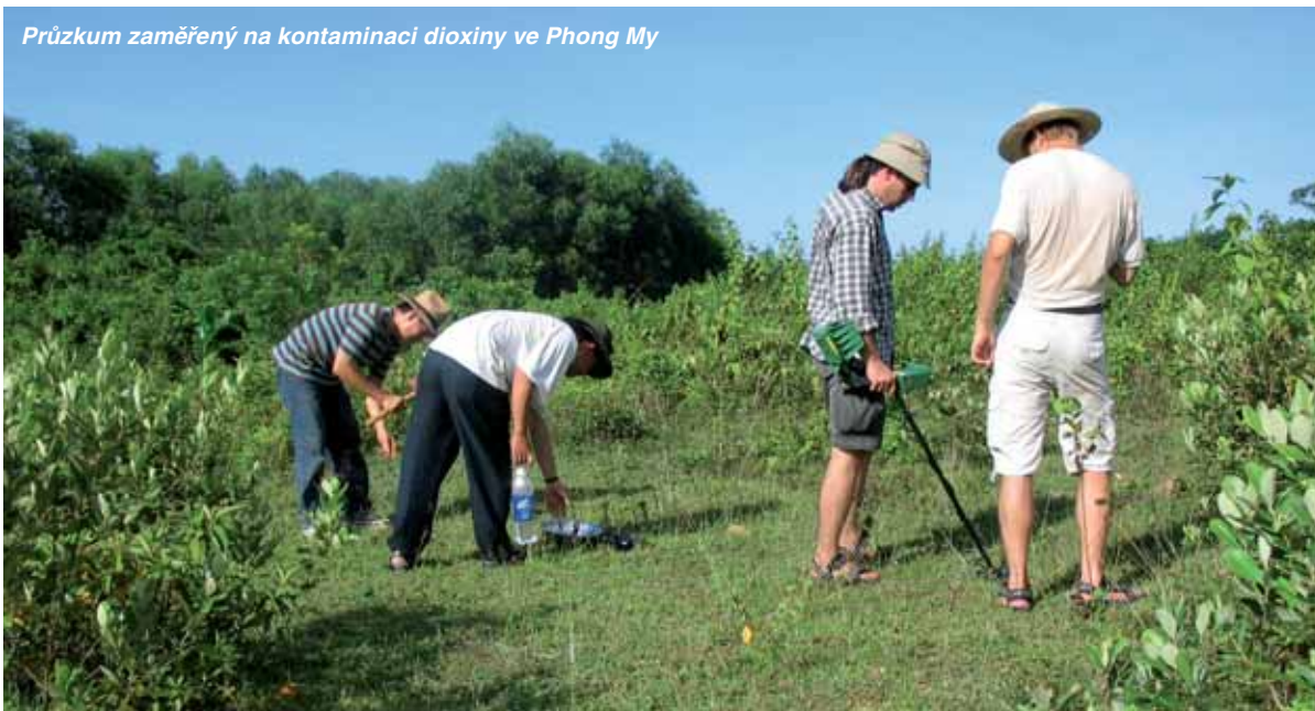
Průzkum zaměřený na kontaminaci dioxiny ve Phong My

Přes všechny odlišnosti od našich vlaků a dílčí komplikace je jízda vlakem příjemným zážitkem. Většinou potkáte hodně zajímavé lidi navíc si cestou prohlédnete vietnamský venkov, což se vám pravděpodobně jinak nepovede.