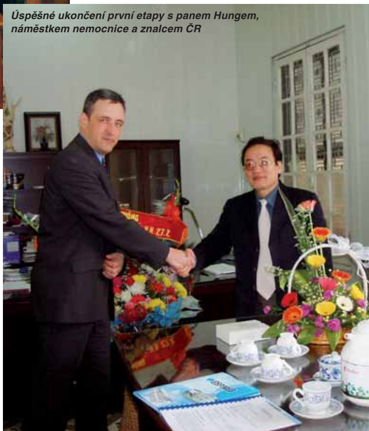
Úspěšné ukončení první etapy s panem Hungem, náměstkem nemocnice a znalcem ČR

Samozejmě největším přínosem projektu je zvyšování kvality poskytované zdravotní péče obyvatelům Haiphongu. Nově otevřený pavilon, z velké části s českými přístroji a ostatním vybavením (lůžka, operační světlá, operační stoly), je vysoce kladně hodnoceným příspěvkem ke komfortu pacientů i personálu a úrovni poskytované péče. Za společnost Hospimed jsem rád, že můžeme být jedněmi z těch, kteří vidí Vietnam jako perspektivní zemi s milými lidmi, zemi se složitou minulostí ale jistě velmi perspektivní budoucností.