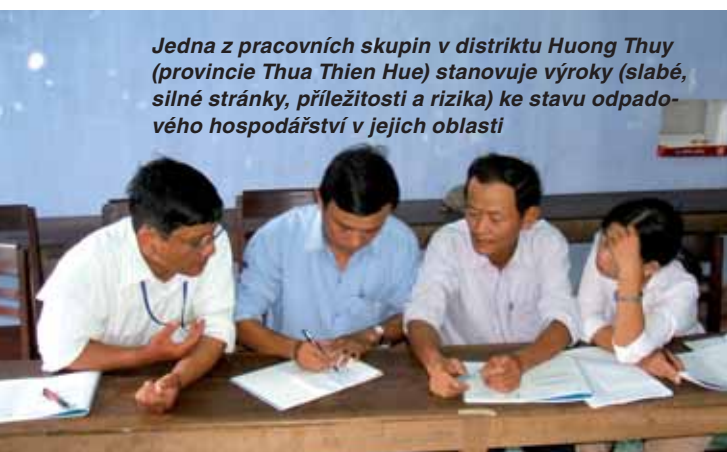
Jedna z pracovních skupin v distriktu Huong Thuy (provincie Thua Thien Hue) stanovuje výroky (slabé, silné stránky, příležitosti a rizika) ke stavu odpadového hospodářství v jejich oblasti

Vyprodukované odpady z domácností jsou z velké části odhazovány do přírody nebo volně páleny před domy. Se zvyšujícím se podílem plastového obalového materiálu je tento způsob neudržitelný. Ve větších městech fungují technické služby, které provádějí sběr odpadů, ty jsou pak svázeny na různé zabezpečené