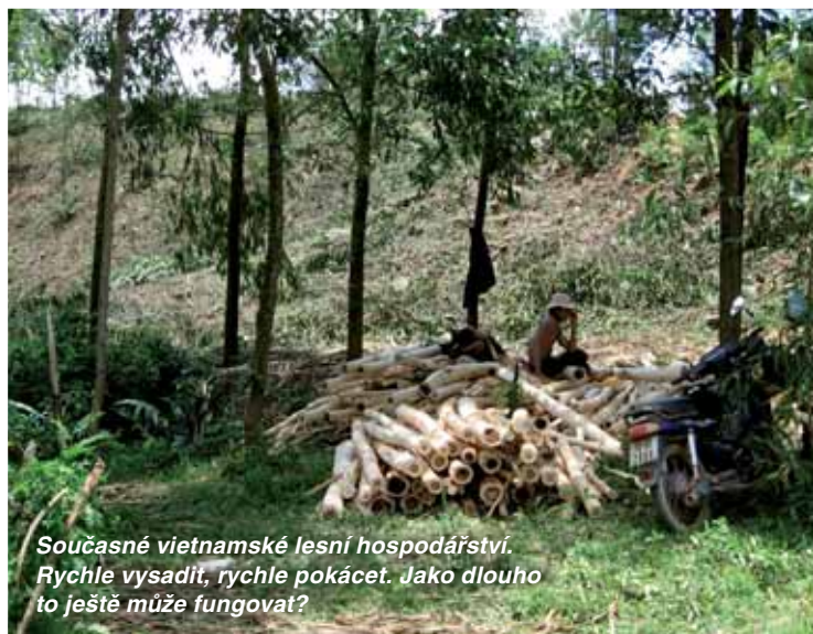
Současné vietnamské lesní hospodářství. Rychle vysadit, rychle pokácet. Jako dlouho to ještě může fungovat?

Dalším výrazným rysem vietnamských kolegů je snaha mít vše pod maximální kontrolou. Vietnam je národ mimořádně organizovaný, v šest hodin ráno tu všichni na povel vstávají a odcházejí do práce, stejně tak úderem desáté hodiny večerní Vietnamci spořá-