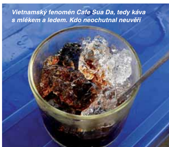
Vietnamský fenomén Cafe Sua Da, tedy káva s mlékem a ledem. Kdo neochutnal neuvěří

mnoho míst, kde je možné uplatnit programy v rámci ZRS České Republiky. Důležitý je ale výběr vhodných lokalit a témat s jasnými podmínkami realizace, které budou předjednány s místními úřady např. na úrovni našeho zastupitelského úřadu. Zařazení Vietnamu mezi prioritní země ZRS ČR má své opodstatnění už z hlediska nadstandardních vazeb z nedávné minulosti a právě proto by bylo jistě velice prospěšné mít na vládní úrovni podepsané „Memorandum of Understanding“, které by přesně definovalo, za jakých podmínek se bude zahraniční rozvojová spolupráce ČR realizovat. Neboť ve Vietnamu více než kdekoli jinde platí zásada, že co je psáno, to je dáno.