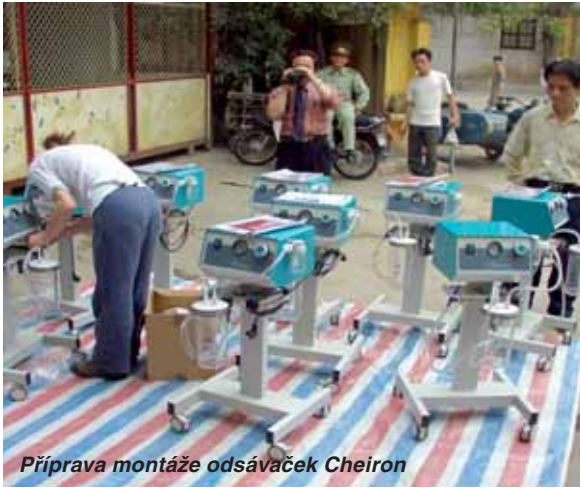
Příprava montáže odsávaček Cheiron

Ministerstva zdravotnictví Vietnamu a pozice nemocnice v tomto dlouhodobém plánu. Při našich návštěvách v nemocnici je každoročně upřesňován seznam technologií, které si nemocnice přeje v budoucnu dodat. Tento seznam prioritních položek je konfrontován jednak s ročním objemem uvolněných prostředků z české strany, jednak s možnostmi českých výrobců dodat techniku, která je schopna obstát zejména ve velmi náročných klimatických podmínkách přímořské polohy Haiphongu. A že to není jednoduché, se přesvědčili již mnozí čeští výrobci.