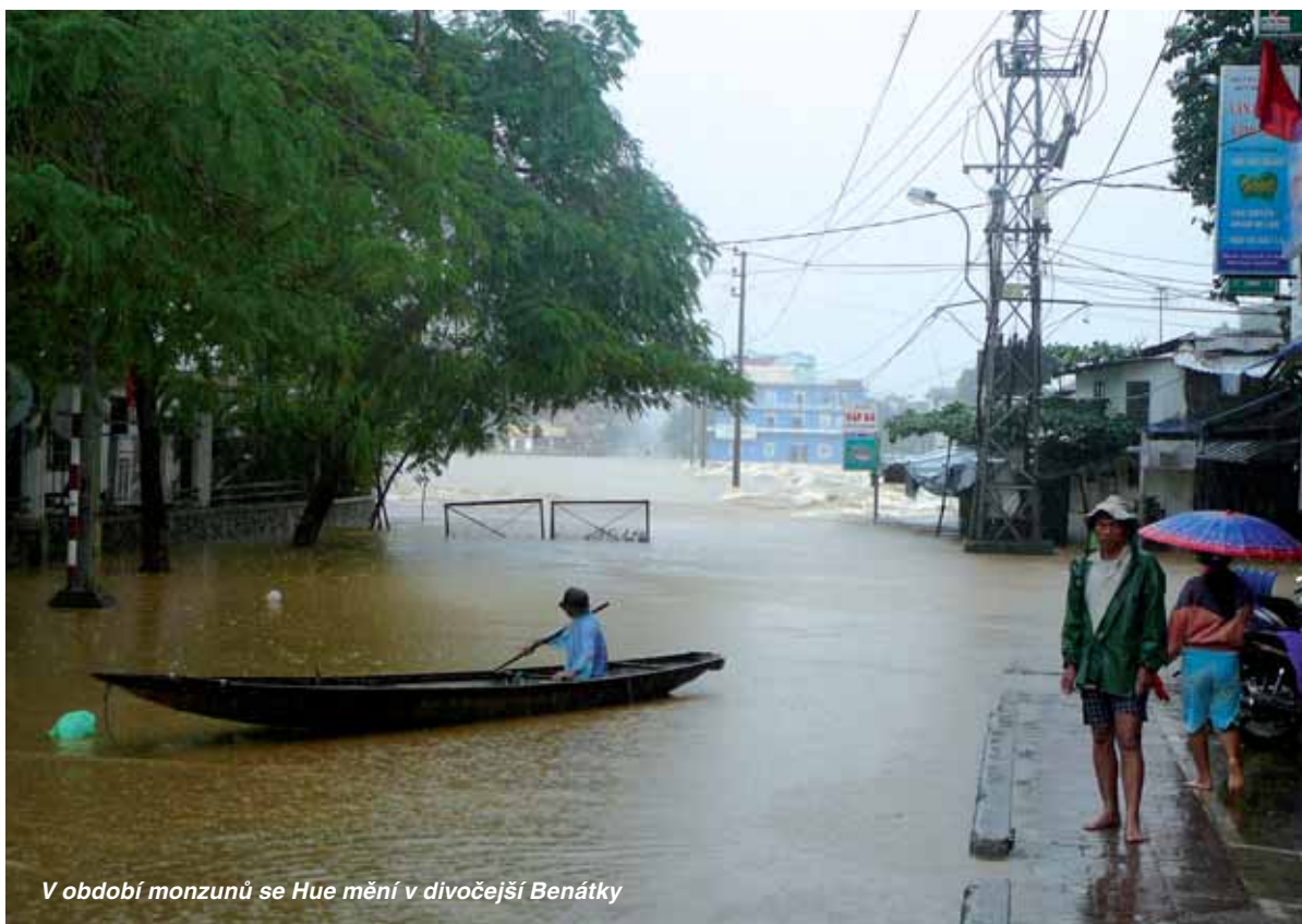
V období monzunů se Hue mění v divočejší Benátky

Kromě působení na venkově je člověk ovlivněn, nebo naopak ovlivňuje i městský život. V našem případě se jedná o město Hue v centrálním Vietnamu, kterým protéká Voňavá řeka a které je mimo jiné posledním císařským městem a kde za Americko-Vietnamské války zuřily nelítostné boje.