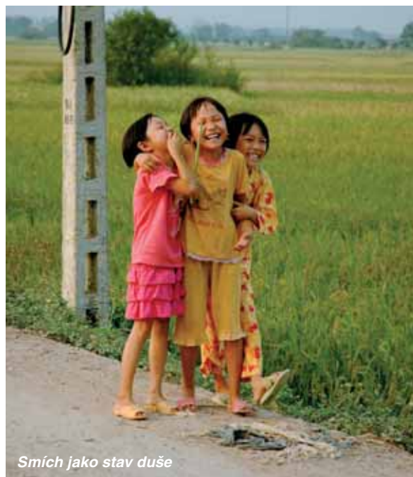
Smích jako stav duše