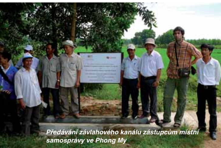
Předávání závlahového kanálu zástupcům místní samosprávy ve Phong My

K problematice zavádění nových technologií bychom mohli opět uvést názorný příklad. Jednou z našich