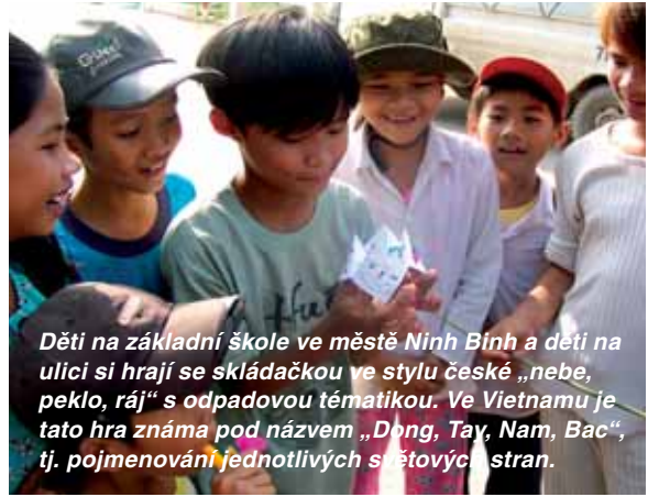
Děti na základní škole ve městě Ninh Binh a děti na ulici si hrají se skládačkou ve stylu české „nebe, peklo, ráj“ s odpadovou tematikou. Ve Vietnamu je tato hra známa pod názvem „Dong, Tay, Nam, Bac“, tj. pojmenování jednotlivých světových stran.

či spíše nezabezpečené skládky. V některých osvětlenějších obcích fungují skupiny dobrovolníků, kteří pomocí příručních vozíků provádějí sběr od občanů. Odpady jsou pak shromažďovány na prozatímních skládkách, které jsou naprosto nezabezpečené.