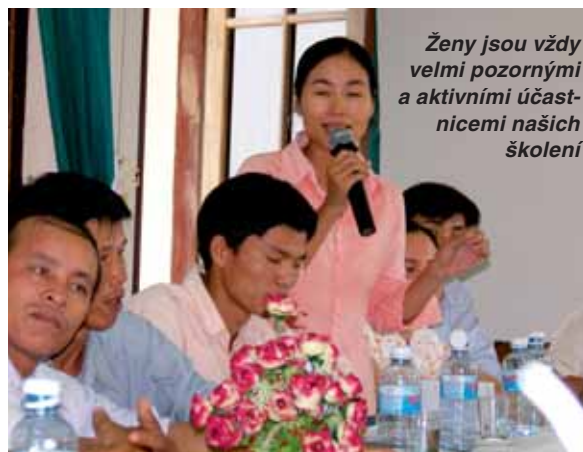
Ženy jsou vždy velmi pozornými a aktivními účastnicemi našich školení