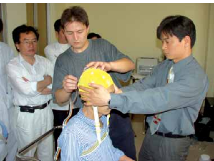
První pacient vyšetřovaný novým EEG

V roce 2006 se začal stavět další pavilon a jestli vyjdou plány na zrušení přilehlé věznice a místo dozorců na strážních věžích bude okolí střežit vrátný supermoderní nemocnice, stane se Viet Tiep jednou nejen z největších, ale i nejmodernějších nemocnic v zemi.