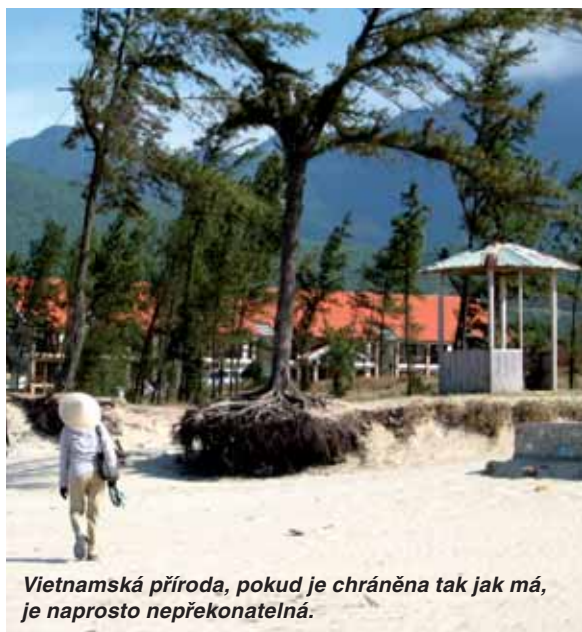
Vietnamská příroda, pokud je chráněna tak jak má, je naprosto nepřekonatelná.

daně opouštějí do té doby hlučné ulice. I v té nejzapatlejší vesnici existují přesné statistické přehledy o tom, jaké způsoby antikoncepce tamní ženy používají a kolik dětí v průběhu posledního roku chodilo za školu a jak často. Vietnamci mají zkrátka absolutní přehled a kontrolu naprosto nad vším. Řád, který se Vietnamci věrní své vynalézavosti neustále snaží ze všech sil obházet, je všudypřítomný. Stejný systém kontroly a řízení se pochopitelně snaží vietnamská strana zavést také do realizace vašeho společného projektu. Fráze začínající „You should...“ tedy rady, co vše byste v projektu měli změnit dle představ vietnamské strany a co přesně byste měli udělat, jsou zcela na denním pořádku. O tom, co byste měli udělat vy, mají vietnamští partneři naprosto jasnou představu. O tom, co by měli dělat oni, už tak úplně jasná představa neexistuje. A pokud chcete přimět Vietnamce k intenzivní a kvalitní práci, je třeba je prvně nadchnout pro věc