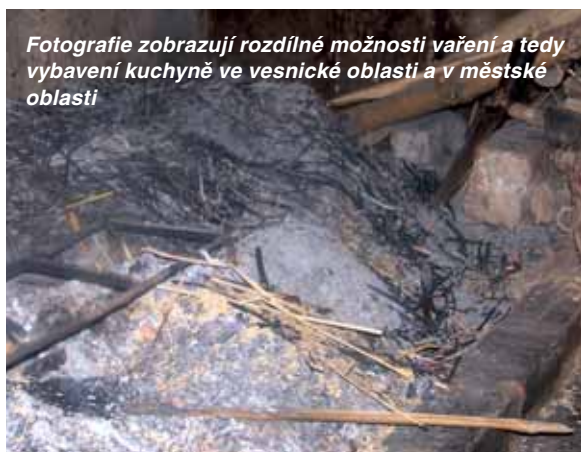
Fotografie zobrazují rozdílné možnosti vaření a tedy vybavení kuchyně ve vesnické oblasti a v městské oblasti